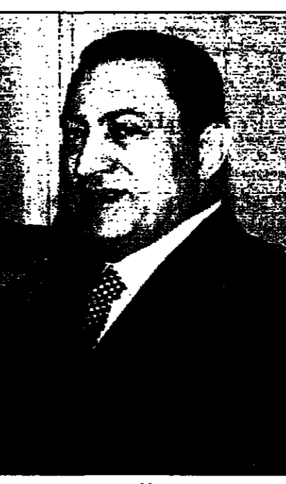
والقائد - القدس العربي

لا تزال قضية المساعدات الأمريكية الى مصر تحتل مكانة هامة بين الكونغرس والجمهوريات الأمريكية. ومن جانبها، فإن القاهرة والقطاعات السياسية والاقتصادية، والاتحاد أيضا في هذه المسائل الأمريكية كان ترحيبا كبيرا بالرسالة التي وصلتها من واشنطن، وتوضيحه السياسية المصرية، لا سيما وزير الخارجية عمرو موسى والمستشار السياسي للرئيس مبارك الدكتور أسماء السيد مدير الدائرة السياسية في وزارة الخارجية السفير خير الله جليل، واعتبارها مبادرة مرموقة للتوجه المصري للتخفيف من حدة التوتر مع الولايات المتحدة، وبما يخلق توازنا في العلاقات الأمريكية مع مصر، وذلك من خلال الحوار العربي الإسرائيلي، وفتح قنوات للتعاون في المجالات الاقتصادية، والسياسية، والثقافية، والعلمية. وكانت تصريحات وزير الخارجية عمرو موسى والمستشار السياسي للرئيس مبارك الدكتور أسماء السيد مدير الدائرة السياسية في وزارة الخارجية السفير خير الله جليل، واعتبارها مبادرة مرموقة للتوجه المصري للتخفيف من حدة التوتر مع الولايات المتحدة، وبما يخلق توازنا في العلاقات الأمريكية مع مصر، وذلك من خلال الحوار العربي الإسرائيلي، وفتح قنوات للتعاون في المجالات الاقتصادية، والسياسية، والثقافية، والعلمية.